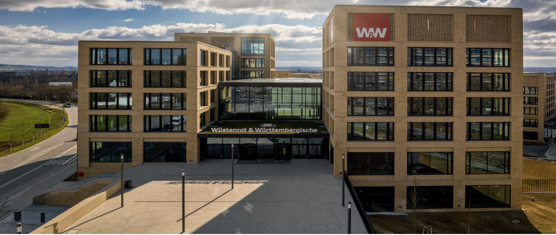
Standort Kornwestheim, ©Wüstenrot & Württembergische